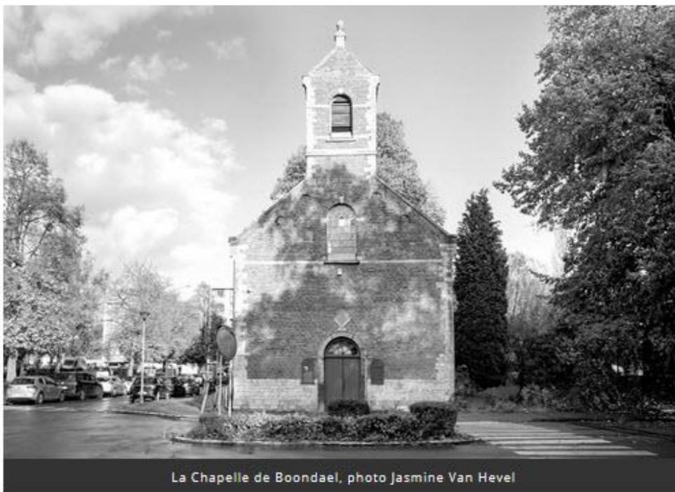
La Chapelle de Boondael